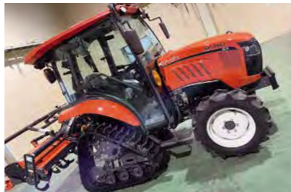
当社イチオシのトラクター。おすすめの商品が揃っております。