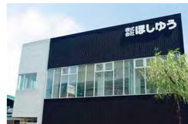
パッケージのトータルプロデュース企業。