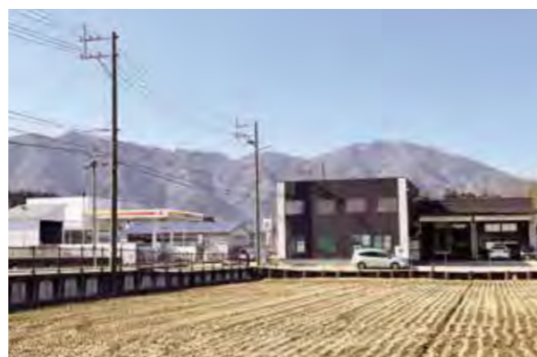
地域になくはない、お役に立てる存在を目指します。

全国ダイハツベストピット店大会(東日本地区)で総合表彰最優秀販売店を受賞しました。ご愛顧下さったお客様に感謝いたします。引き続き販売とアフターサービスに全力で取り組んでまいります。