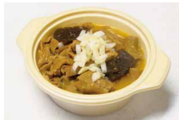
一押し商品のモツ煮。