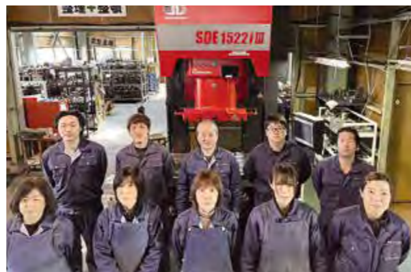
代表者と従業員の皆さん。