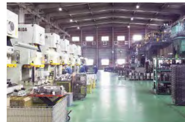
工場内風景/ものづくりに興味のある方、いつでも工場見学できます。連絡お待ちしております。