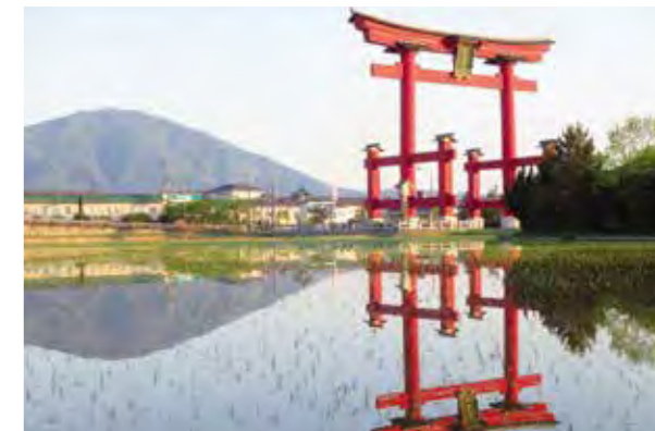
弥彦神社御遷座百年記念事業の一環として大鳥居の塗装替え工事を行いました。(2014年当時)