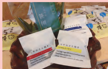
どら焼き 210yen 笹団子 860yen