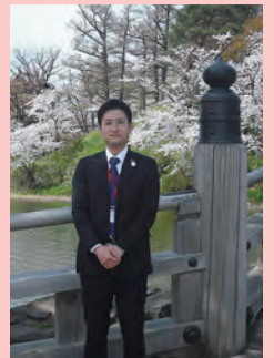
取材した高田支店朝妻職員

○情報 住 所：上越市本城町44-1 開催時期：毎年3月下旬～4月中旬 ※詳細は上越市のHP等でご確認ください。 (2023年は3/28～4/12で開催) ※桜のライトアップは日没～21時までです。