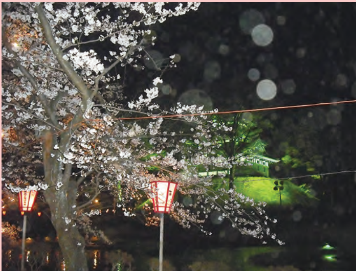
夜はお城もライトアップされます！