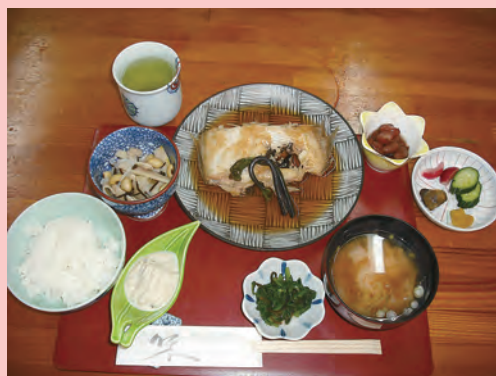
お得なランチ 1,200円 (取材日はきくがれのあげ煮)