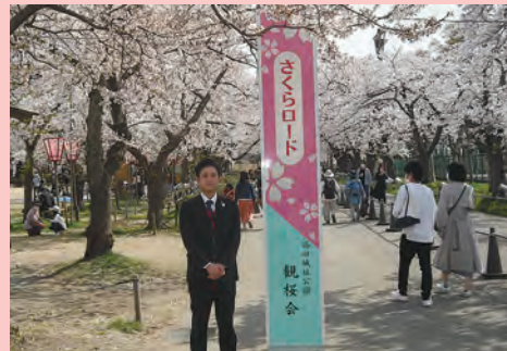
昼間の写真ですが、「桜ロード」は夜桜が特にきれいです。