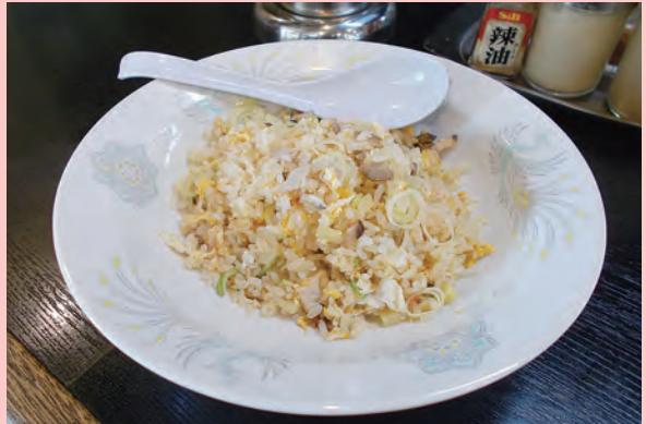
チャーハン 950円 (写真は半チャーハン 500円)