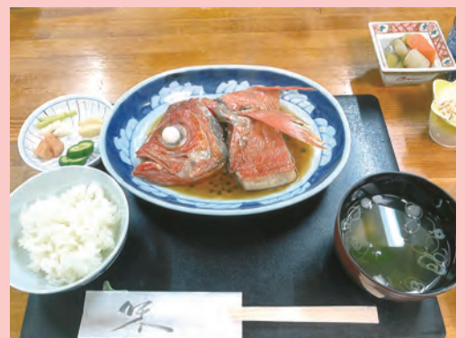
今日のおすすめ 煮魚御膳 1,950円 (取材日は金目鯛の煮付け)

住 所：上越市大町3-1-11 T E L：025-522-4020 営業時間：11：30～14：00 17：30～21：30 定休日：日曜日、第3月曜日、祝日