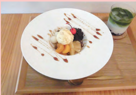
クリーム白玉あんみつ 720yen あんこラテ (抹茶) 580yen