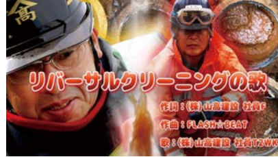
▲主題歌もあります！