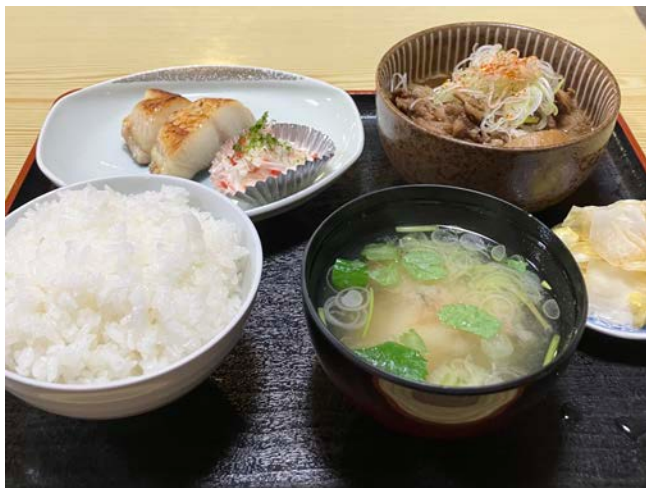
▲ボリューム満点のおまかせ定食