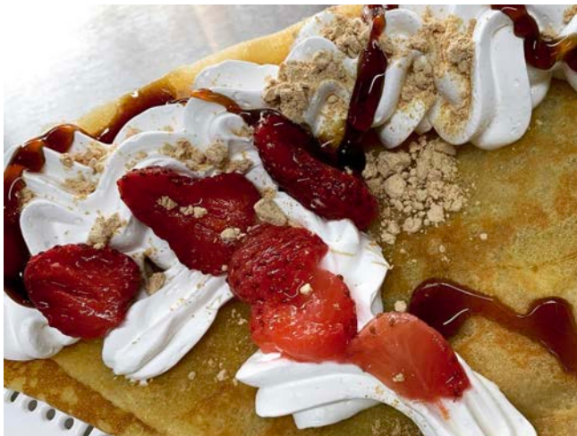
▲美味しいクレープがたくさんあります！