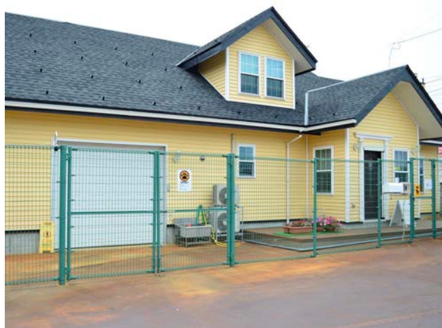
▲店舗は黄色い建物です