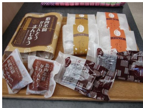
「かりんとうまんじゅう」など