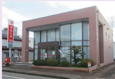
新潟県信用組合 三条東支店