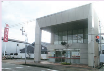
新潟県信用組合 三条支店