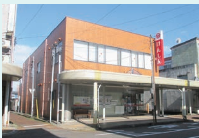
新潟県信用組合 見附支店・今町支店