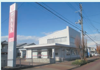
新潟県信用組合 中之島支店