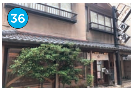
いがた2kmエリア 和食