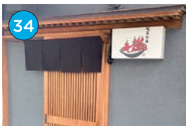
いがた2kmエリア 中華