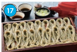
にいがた2kmエリア 蕎麦