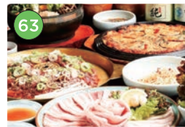
中央区エリア一韓国料理