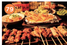
西区エリア一居酒屋