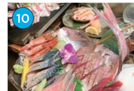
にいがた2kmエリア 居酒屋