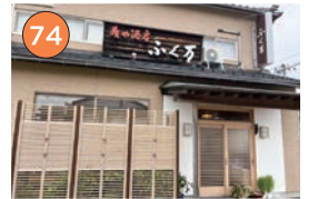
西区エリア一和食