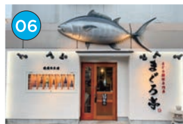
にいがた2kmエリア 居酒屋