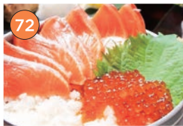
西区エリア一居酒屋