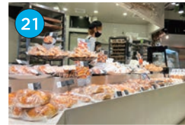
いがた2kmエリア パン