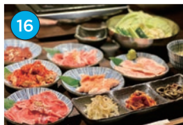
にいがた2kmエリア 焼肉