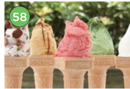
中央区エリア一ジェラート