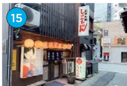
にいがた2kmエリア 居酒屋