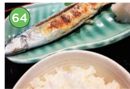
中央区エリア一和食