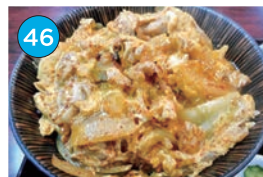
いがた2kmエリア「和食」