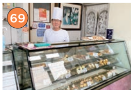
西区エリア一洋菓子