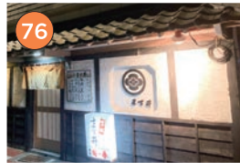
西区エリア一和食