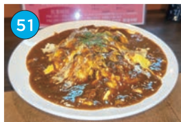
いがた2kmエリア「居酒屋」