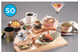
いがた2kmエリア「和食」