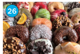
いがた2kmエリア 洋菓子・パン