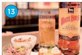
にいがた2kmエリア アメリカンバー