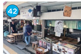
いがた2kmエリア「海産物・お惣菜」