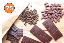
西区エリア一洋菓子