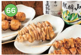
中央区エリア一居酒屋