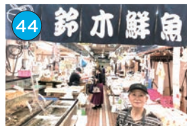
いがた2kmエリア「鮮魚」