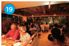
にいがた2kmエリア 居酒屋