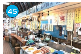
いがた2kmエリア「鮮魚」