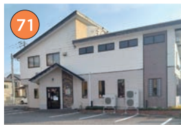
西区エリア一ラーメン