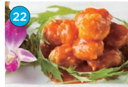
いがた2kmエリア 中華