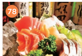
西区エリア一居酒屋