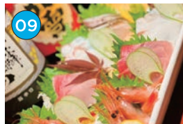
にいがた2kmエリア 居酒屋