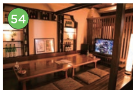
中央区エリア「居酒屋」