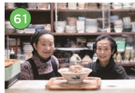
中央区エリア一食堂