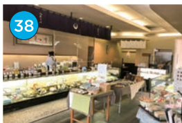
いがた2kmエリア 和菓子