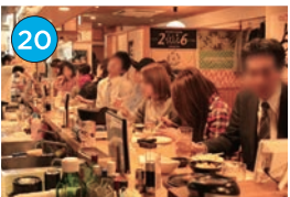
にいがた2kmエリア 居酒屋