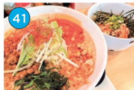
いがた2kmエリア「ラーメン」