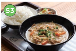
中央区エリア「豚汁店」