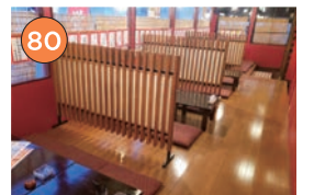
西区エリア一居酒屋