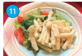
にいがた2kmエリア 居酒屋