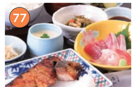
西区エリア一和食