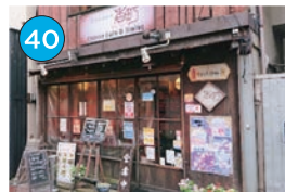
いがた2kmエリア「中華」