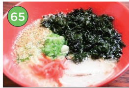
中央区エリア一ラーメン