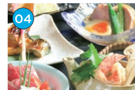
にいがた2kmエリア 和食