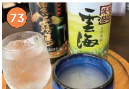
西区エリア一蕎麦