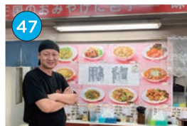
いがた2kmエリア「中華」