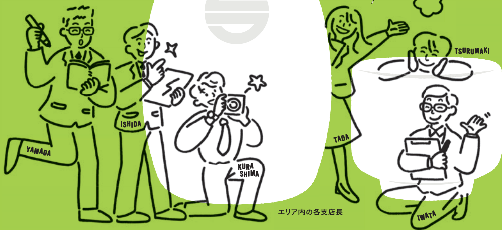
エリア内の各支店長