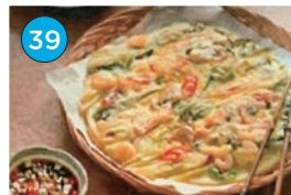
いがた2kmエリア「韓国料理」