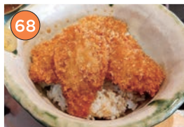
西区エリア一和食