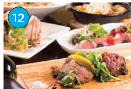
にいがた2kmエリア 洋食