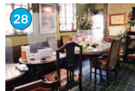
いがた2kmエリア 中華