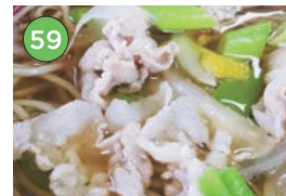
中央区エリア一蕎麦