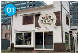
にいがた2kmエリア 居酒屋