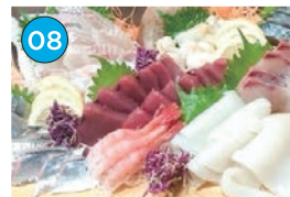
にいがた2kmエリア 居酒屋