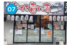
にいがた2kmエリア 居酒屋