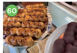
中央区エリア一和菓子