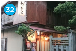
いがた2kmエリア 和食