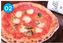
にいがた2kmエリア 居酒屋