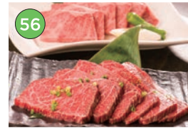
中央区エリア一焼肉