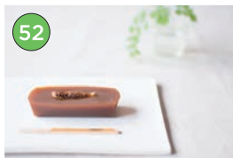
中央区エリア「和菓子」