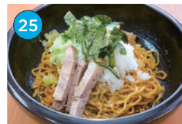
いがた2kmエリア ラーメン