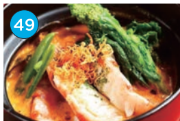
いがた2kmエリア「洋食」