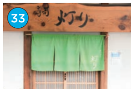
いがた2kmエリア 寿司