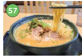
中央区エリア一ラーメン