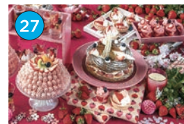
いがた2kmエリア 洋食