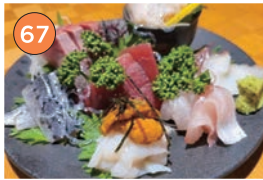
西区エリア一和食