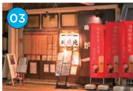
にいがた2kmエリア 居酒屋