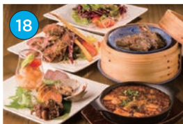
にいがた2kmエリア 中華