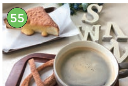
中央区エリア「パン」