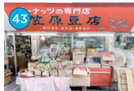
いがた2kmエリア「豆菓子」