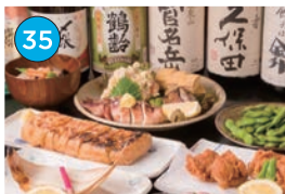
いがた2kmエリア 居酒屋