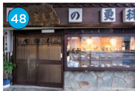
いがた2kmエリア「蕎麦」