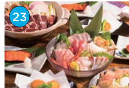
いがた2kmエリア 居酒屋